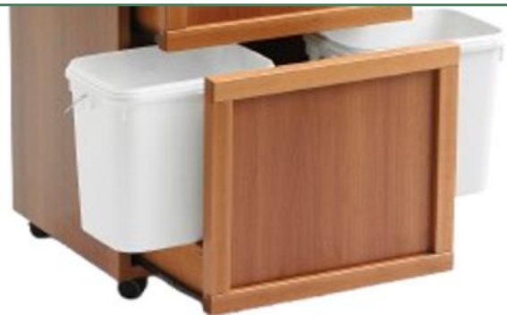
Estraibile - Extractable